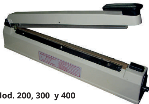
Mod. 200, 300 y 400

La máquina libera el anclaje una vez ha terminado el proceso de sellado.